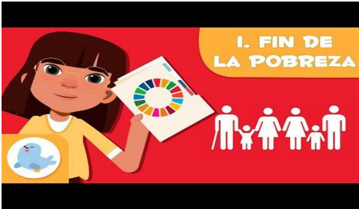
ODS 1 | Fin de la pobreza