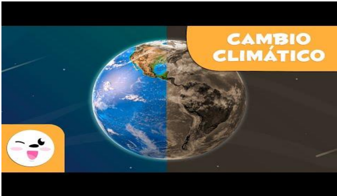
El Cambio Climático | Videos Educativos para Niños