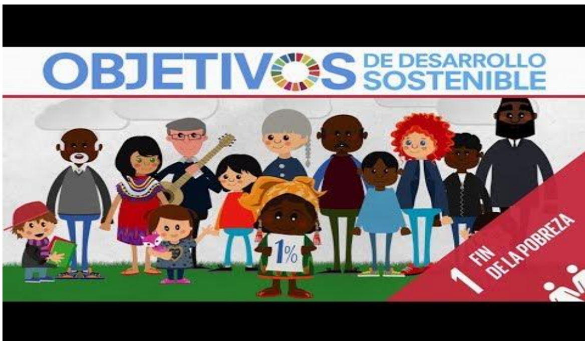
ODS 1: Fin de la pobreza