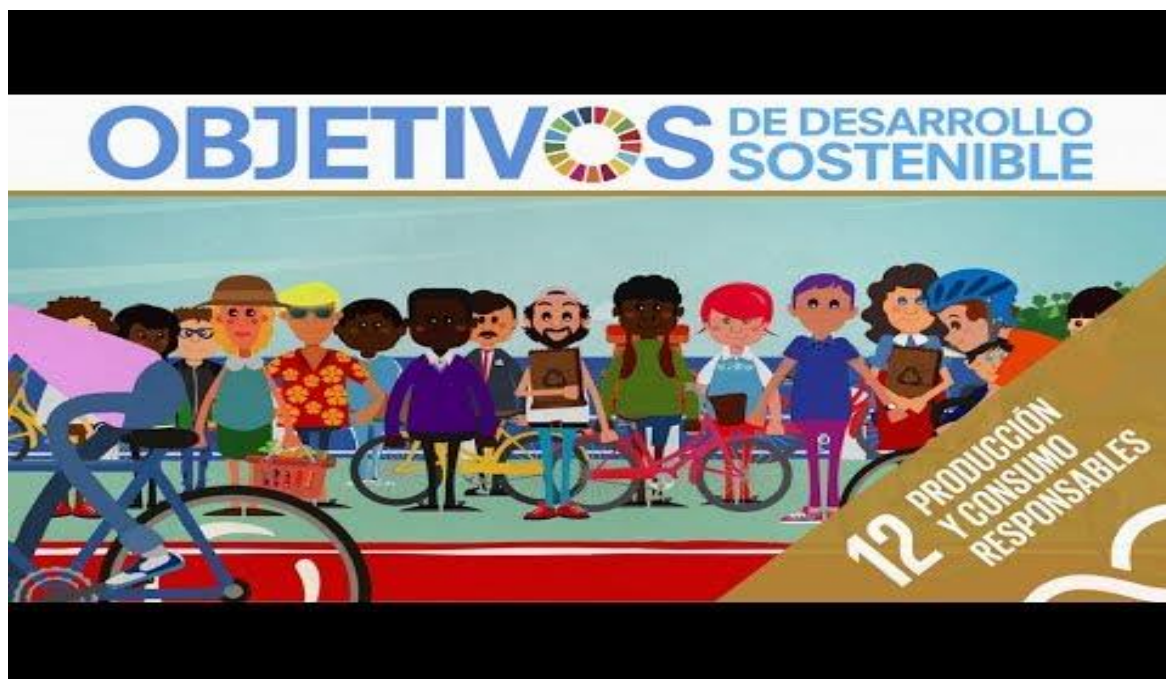
ODS 12 | Producción y Consumo Responsables