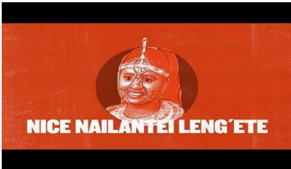
Corto ganador - Por el Principio - igualdad de género - coeducación primaria