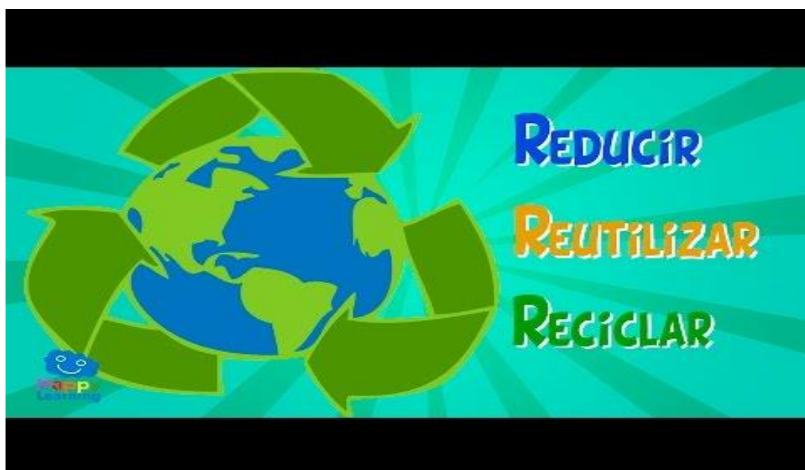
Reducir, Reutilizar y Reciclar. Para mejorar el mundo | Videos Educativos para Niños