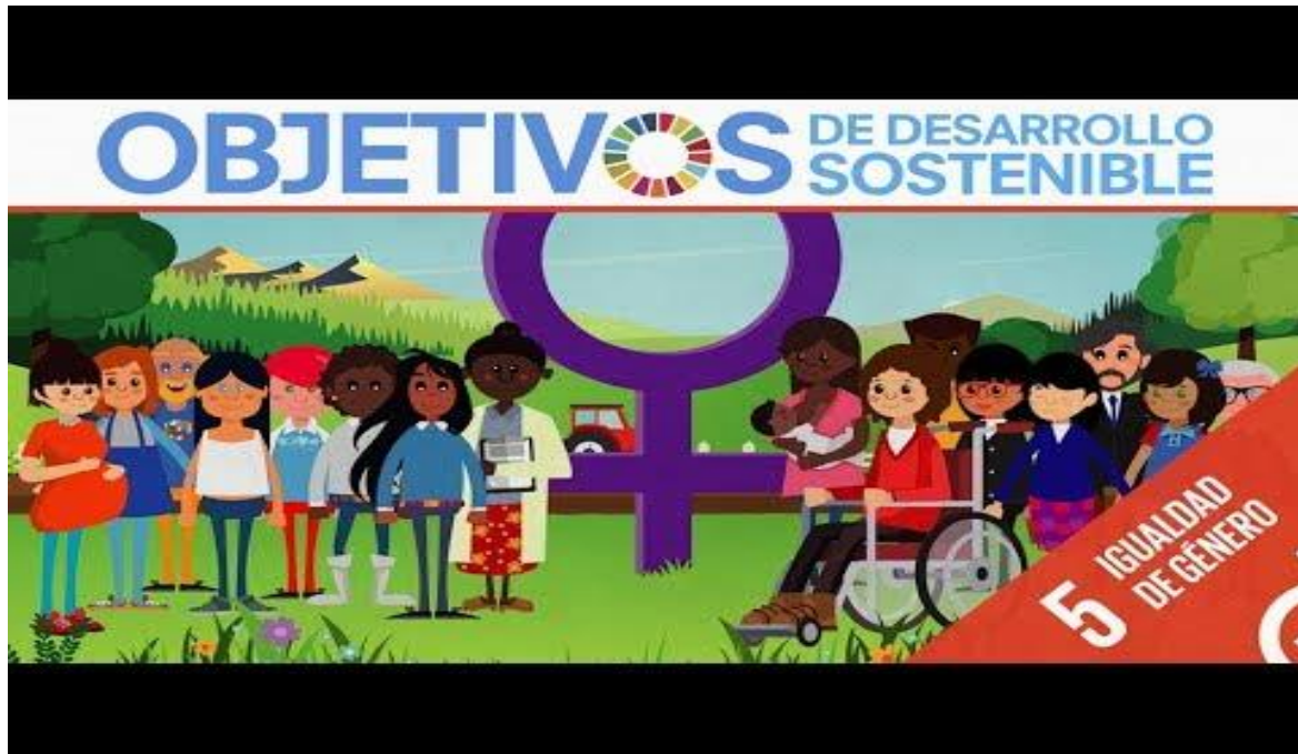
ODS 5: Igualdad de género